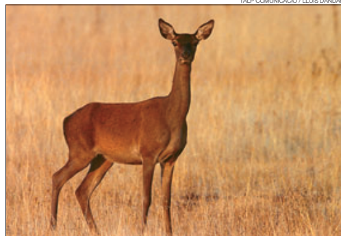
►► Una hembra, en Cabañeros.

Las dehesas extremeñas son los lugares más célebres para disfrutar de la berrea del ciervo en España. Las dehesas, que se extienden al pie de las encinas del parque natural de Monfragüe (Cáceres), son rincones excepcionales para asistir a la batalla. Otro lugar destacable son los alrededores del pantano del Tranco, en la sierra de Cazorla (Jaén). En estas lares, Félix Rodríguez de la Fuente immortalizó los combates de los machos.